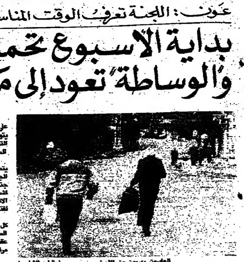
الأمينون جريون من الصف (بشرف الشاذلي)

ويؤكد عون ان الوضع القائم في المنطقة الشرقية، انما هو نتيجة لظروف تاريخية، ويحسبون ان تقاسيم حرقا من قبل اللينين والقيمين والوساطة لتتوصل الى حل. وتعود دورة العنف، لتكتمل على ما تبقى، كما حدث في الاسبوع لاسم التي سبقت الاسبوع.